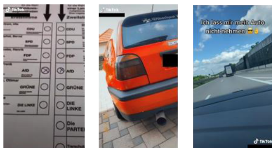
Abbildung 3: Ausschnitte aus Video #28 (26.09.2021)

In einer weiteren Videokategorie treten Creator*innen in den Hintergrund und das Automobil wird selbst als handlungstragendes Element gezeigt. Diese Videos werden genutzt, um etwa Sympathien mit der AfD oder eine Nähe zu Patriotismus bis Nationalismus zu transportieren.