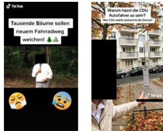
Abbildung 1: Ausschnitte aus den Videos #8 (01.08.2022) und #41 (10.11.2024)

Andere Videos zeigen Politiker*innen in der Rolle als Berichterstatter*innen. Ästhetisch wird dies mit Gegenschnitten von Außenaufnahmen der thematisierten Orte gestützt, die die eigene Aussage vermeintlich objektiv in Szene setzen. So bezieht beispielsweise eine Politikerin Position gegen das Stadtradeln. Den schlechten Zustand der ortseigenen Asphaltstraßen kritisiert sie als „Gefahrenzone“ und den Wettbewerb als „Steuerverschwendung“. Die Argumentation wird hier mit Ansichten von Radfahrenden gestützt, die Schlaglöcher überqueren (Video #5, 27.08.2025). In gleicher Ästhetik werden in anderen Videos etwa der geplante Bau von Fahrradwegen thematisiert, der das Fällen von Bäumen und den Wegfall von Parkplätzen in der Innenstadt erwarten lasse (Video #8, 01.08.2022) oder die Belegung eines Parkplatzes mit einer Parkuhr kritisiert (Video #41, 10.11.2024). Mit den Hashtags „#Aufklärung“ und „#Fakten“ wird die eigene Position als Berichterstatter hierbei weiter plausibilisiert.