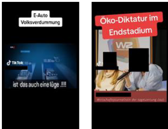
Abbildung 2: Ausschnitte aus den Videos #33 (03.04.2023) und #51 (29.08.2024)

In einer weiteren Videokategorie treten Creator*innen in den Hintergrund und das Automobil wird selbst als handlungstragendes Element gezeigt. Diese Videos werden genutzt, um etwa Sympathien mit der AfD oder eine Nähe zu Patriotismus bis Nationalismus zu transportieren.