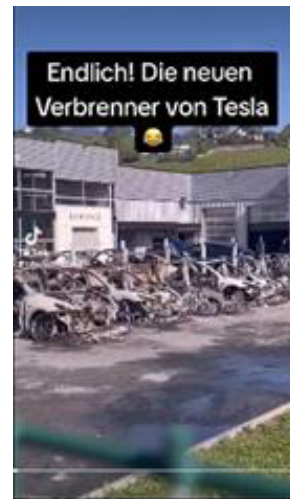
Abbildung 6: Ausschnitt aus Video #55 (30.10.2023)

In der Analyse fanden sich zahlreiche Videos, die Humor zur Vermittlung der Inhalte und als zentralen Bestandteil der Selbstdarstellung, insbesondere Ironie und Sarkasmus, verwenden (vgl. dazu Abbildung 6). Hier stechen jene Akteur*innen hervor, die aktuelle Nachrichten oder Zusammenhänge aufgreifen und sarkastisch-ironisch kommentieren. Eine*r diese*r Creator*innen stellt im Dezember 2024 ein Video online, in dem die zum Zeitpunkt der Videoveröffentlichung publik gewordene Unterstützung der AfD durch Elon Musk kommentiert wird. In sarkastischem Ton bringt das Video dies in Verbindung zum Thema E-Mobilität: „Jetzt, wo Elon Musk öffentlich die AfD unterstützt, müssten doch eigentlich alle rot-grün Tesla-Fahrer sofort ihre E-Schlitten abstoßen, oder? [...] Vielleicht gründen die Grünen bald eine Initiative: ‘Fahrrad statt Faschomobil.’ [lacht] Und bei der nächsten Fridays-for-Future-Demo wird der Tesla symbolisch auf dem Marktplatz verbrannt. Natürlich CO2-neutral. [lacht] ,Wir sind ja keine Wilden, ne.““ (Video #22, 29.12.2024).